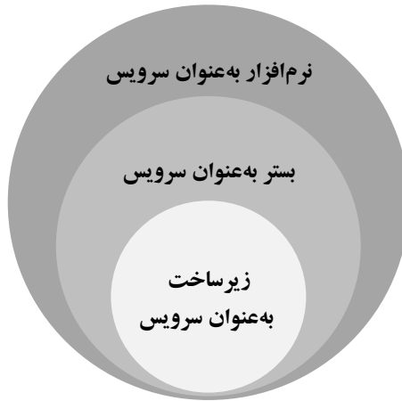
شکل ۱. سطوح انتزاعی سرویس‌های رایانش ابری