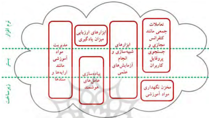
شکل ۲. چگونگی به‌کارگیری سرویس‌های رایانش ابری (سرویس زیرساخت، بستر، و نرم‌افزار) به‌منظور پیاده‌سازی قابلیت‌های متداول یک محیط یادگیری و آموزش الکترونیکی

بازخوردهایی را تولید می‌کنند. این بازخوردها، هم می‌تواند در اختیار اساتید قرار گیرد و هم می‌تواند به‌عنوان مبنایی برای کمک به دانشجویان برای یادگیری مؤثرتر آنان باشد. قابلیت‌هایی را که برای محیط یادگیری الکترونیکی به آنها اشاره شد، می‌توان به شیوه‌های مختلف و با به‌کارگیری سرویس‌های رایانش ابری (سرویس زیرساخت، بستر، و نرم‌افزار) پیاده‌سازی نمود که نمونه‌ای از آن در شکل ۲ نشان داده شده است.