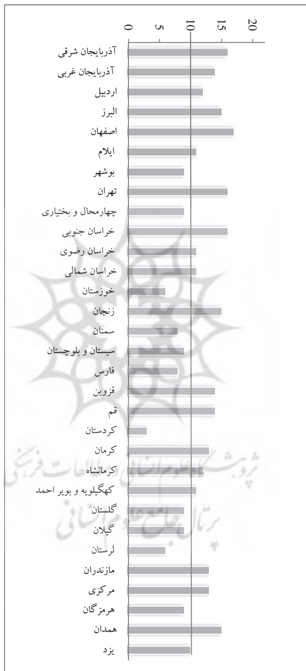
نمودار ۵. امتیاز کسب شده توسط هر وبسایت در معیار پیوندها