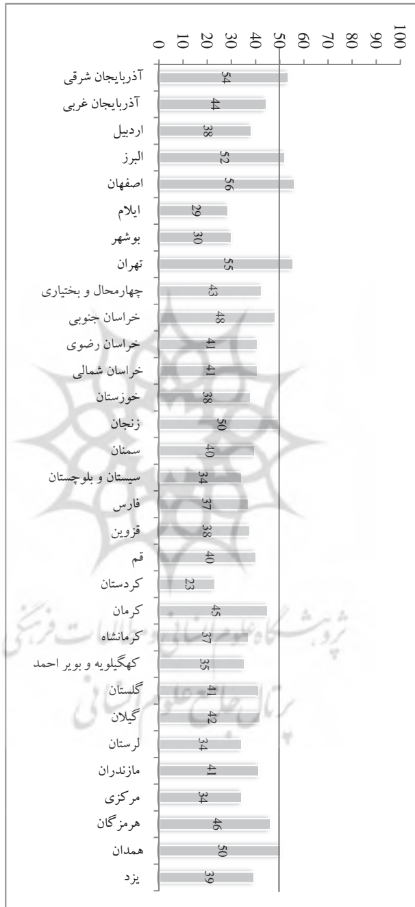
نمودار ۱. امتیاز کلی کیفیت وبگاه‌های استانی نهاد کتابخانه‌های عمومی کشور (درصد)