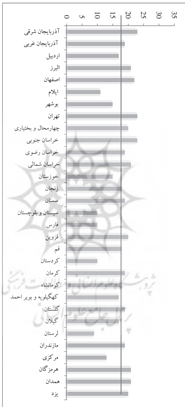
نمودار ۴. امتیاز کسب شده توسط هر وبسایت در معیار روزآمدسازی