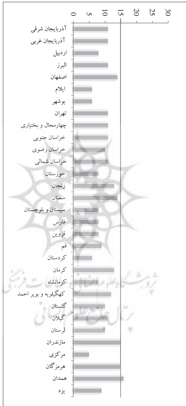
نمودار ۹. امتیاز کسب شده توسط هر وب‌سایت در معیار ساختار