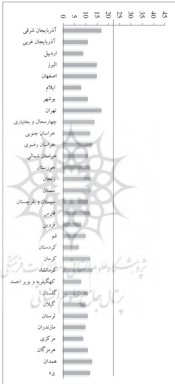
نمودار ۳. امتیاز کسب شده توسط هر وب‌سایت در معیار عملکرد