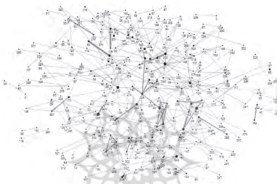
شکل ۲. مصورسازی الگوی هم‌تألفی فصلنامه پردازش و مدیریت اطلاعات

به هنگام وابستگی درون‌سازمانی بوده، بنابراین، می‌توان نتیجه گرفت که تداوم همکاری به خاطر همان ارتباط اولیه و نیز وجود علائق مشترک بوده است.