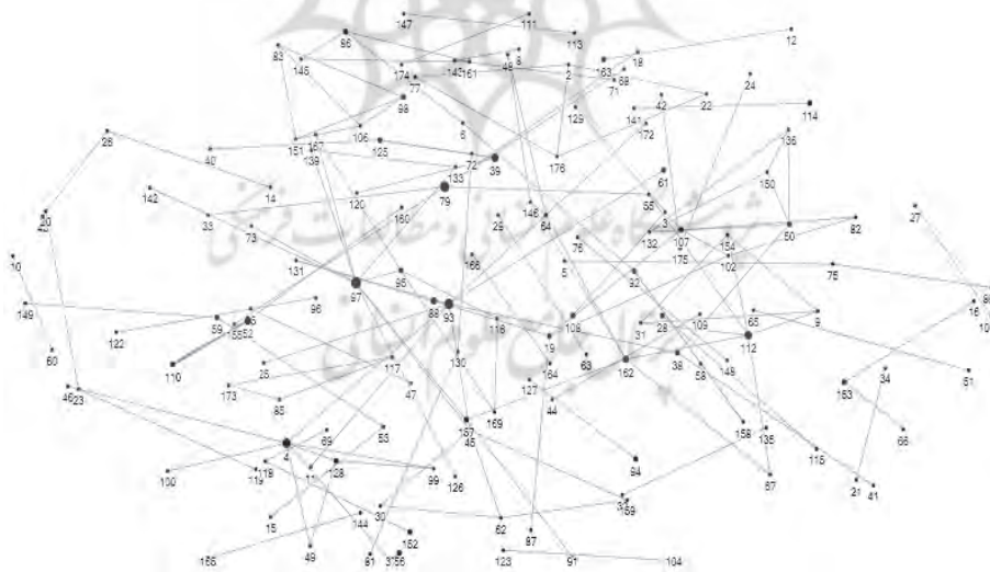
شکل ۱. مصورسازی الگوی هم‌تألیفی فصلنامه تحقیقات کتابداری و اطلاع‌رسانی دانشگاهی