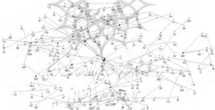
شکل ۳. مصورسازی الگوی هم‌تألفی فصلنامه تحقیقات اطلاع‌رسانی و کتابخانه‌های عمومی

الگوی هم‌تألفی نویسندگان این فصلنامه به واسطه ارتباطات بین نویسندگان در شکل ۳ نشان داده شده است که نشان‌دهنده همکاری علمی بین آنها و نیز تعداد مقالات هر نویسنده است که با حجم گره مشخص می‌شود.