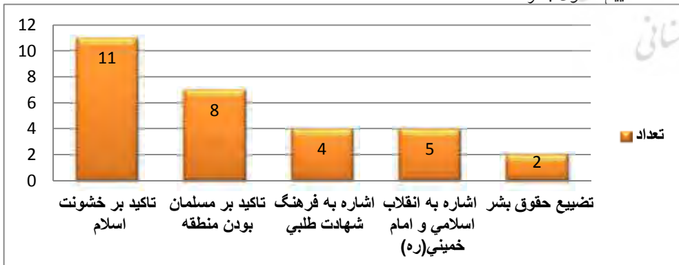
نمودار (۳) کارکرد نمادهای به کار رفته در فیلم‌ها