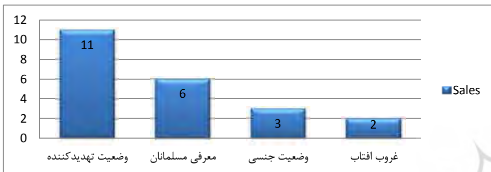
نمودار (۱): نماهای تصویری در هنگام پخش اذان

قالب با نام «وضعیت تهدیدکننده» قرار داده شود و صحنه‌ها جنسی و سخنان جنسی نیز در قالب دیگری با نام «وضعیت جنسی» جای داده شود. همچنین استفاده از صدای اذان برای معرفی مسلمانان و مناطق مسلمان‌نشین در قالب «معرفی مسلمانان» جای گرفته است. با این تفصیل، فراوانی درصد نماها و تصاویر ارائه‌شده در هنگام پخش اذان، به قرار ذیل است: