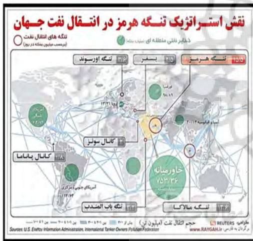
نقشه شماره ۱

کسب می‌کنند. به همین دلیل، از دست اندرکاران نفتی و متخصصان این حوزه همواره شعار ”پرهیز از خام فروشی“ به گوش می‌رسد. با این رویکرد یکی از مشتقات استراتژیک در حوزه پتروشیمی، تبدیل گاز طبیعی به مایع است. این فرآیند از ارزش زیادی برخوردار است. اقتصاد جهانی با تمامی پیچیدگی‌های خود اعم از جهانی شدن، وابستگی متقابل، تأکید بر رقابت بی‌وقفه و ... همچنان وابسته به انرژی نفت و گاز و تأمین امنیت آن است، زیرا انرژی نقطه حرکت و سنگ بنای توسعه اقتصاد جهانی است و روی هم رفته نفت و گاز و صنایع جانبی آن، منبع درآمد، رفاه، اشتغال، امنیت و ثبات کشور به شمار می‌روند. ضمن اینکه با درآمدهای حاصل شده از فروش نفت و گاز می‌توانیم با خرید تجهیزات نظامی پیشرفته تا حدی توانایی‌های دفاعی خود را بالا برده و قدرت چانه زنی خود را افزایش دهیم (سریع القلم، ۱۳۷۶: ۴۳۱). بنابراین با توجه به چنین جایگاهی است که برخی صاحب‌نظران معتقدند نفت و گاز شاهرگ حیاتی اقتصاد و امنیت ایران است.