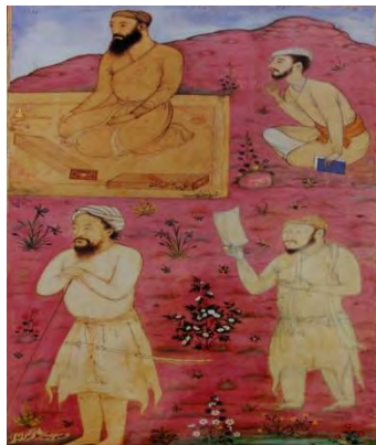
تصویر ۱۱: نگاره «رجال معروف هند»، عبدالصمد، مکتب گورکانی، قرن دهم ه.ق.، نگهداری شده در کتابخانه کاخ گلستان. (مرقع شماره ۲۰۶، شماره ثبت: ۱۶۶۳)

از مرقع گلستان، نگهداری شده در کتابخانه نسخ خطی کاخ گلستان. تصویر رجال معروف هند از قبیل مظفرخان، نظر کوالیالی و قباحاش است که در کمال شباهت تصویر شده (کریم زاده تبریزی، ۱۳۶۳: ۳۳۴). طبیعت پردازی، پرسپکتیو، سایه زنی به وضوح قابل مشاهده است (تصویر ۱۱).