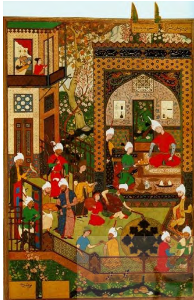
تصویر ۲: نمونه امضای نگارگر، نگاره «بارید برای خسرو می نوازد»، از خمسه نظامی، میرزا علی، مکتب صفوی، تبریز، نگهداری شده در کتابخانه لندن، ۹۴۶ ° ۹۵۰ ه.ق. (en.wikipedia.org، ۱۳۹۳/۷/۱۰)