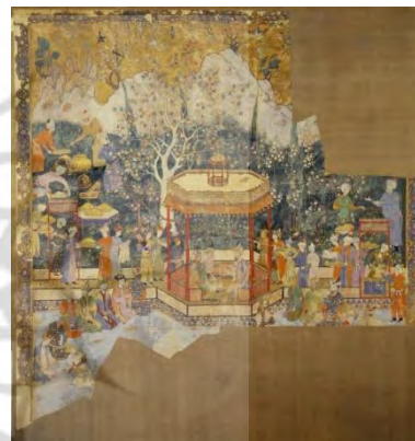
تصویر ۷: نگاره «شاهزادگان سرای تیموری»، منتسب به عبدالصمد، مکتب گورکانی، ۱۵۵۰-۱۵۵۵ م.، نگهداری شده در موزه بریتانیا. ( www.britishmuseum.org , ۹۳/۱۵)