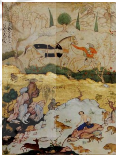
تصویر ۹: نگاره «عمل نوروزی»، عبدالصمد، مکتب گورکانی، ۹۶۵ ه.ق.، نگهداری شده در کتابخانه کاخ گلستان.