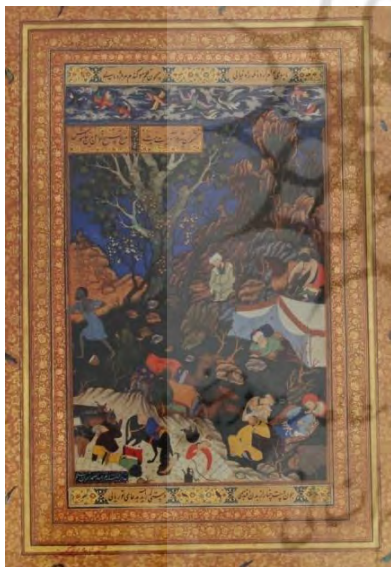
تصویر ۶: نگاره «درویش تسبیح گوی و یاران خفته»، از گلستان سعدی، مکتب صفوی، تبریز، نگهدارنده در کتابخانه کاخ گلستان. (مرقع شماره ۶۳، شماره ثبت: ۱۶۶۳)

هستند (تصویر ۵). نگاره «درویش تسبیح گوی و یاران خفته» یا «کاروانیان خفته و مرد ش—وریده» (The story of the frenzied man and his leaping companions): (حدود ۱۵۴۰ م.، تبریز، از گلستان سعدی، نگهداری شده در کتابخانه نسخ خطی کاخ گلستان). استوارت کری ولش زمان خلق این اثر را در اواخر دهه ۱۵۳۰ م. یا اوایل دهه ۱۵۴۰ م. می داند و معتقد است از دوره پختگی سبک خاص عبدالصمد به دور است. در این نگاره "وضع و موقعیت پیکره ها و شکل سر آدم ها بسیار نزدیک به پیکره های تصویرسازی های شاهنامه شاه طهماسب است. با این وجود برجستگی ها و صخره های پراحساس، درختان پرپشت و تنومند و درویش روان با آرنج های برجسته به روش نقاشی اوایل دوره گورکانی کار شده است" (کن بای، ۱۳۸۴: ۳۳) (تصویر ۶).