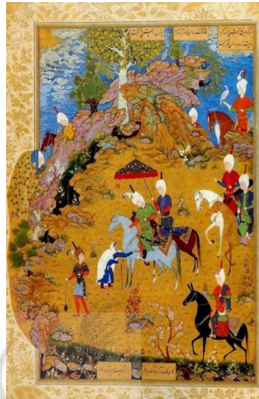
تصویر ۱: نمونه کلاه قزلباش، نگاره «پیرزن و سلطان سنجر»، از خمسه نظامی، منسوب به سلطان محمد، مکتب صفوی، تبریز، حدود ۹۴۹-۹۴۵ ه.ق. (کن بای، ۱۳۹۱: ۸۳).

فضا سازی چند ساحتی؛ رنگ بندی موزون با رنگ های درخشان؛ عدم تمرکز ترکیب بندی بر شخصیت اصلی داستان؛ نمایش هم زمان رویدادهای اصلی و فرعی؛ توجه به واقعیت و برقراری ارتباط میان آدم ها و اشیا و محیط، بیان شاعرانه و خاص طبیعت؛ ترکیب بندی مورب؛ قرارگیری سطوح روی هم برای القای منظره ای عظیم؛ قرارگیری تصاویر پرتحرک در کنار مناظری با تحرک کمتر و طبیعت آرام ویژگی هایی هستند که در آثار این دوره به وفور رویت می شوند (پاکباز، ۱۳۹۰: ۱۵۷؛ اشرفی، ۱۳۸۳: ۸۲).