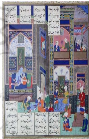
تصویر ۵: نگاره «مرگ خسرو پرویز»، از شاهنامه شاه طهماسب، منتسب به عبدالصمد، مکتب صفوی، تبریز، حدود ۹۴۲ ه.ق.، نگهداری شده در موزه متروپولیتن. (Canby, 2011:280)