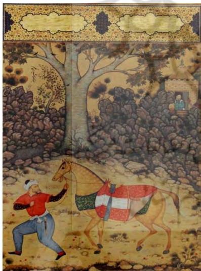
تصویر ۱۰: نگاره «اسب و مهتر»، عبدالصمد، مکتب گورکانی، ۹۶۷ ه.ق.، نگهداری شده در کتابخانه کاخ گلستان. (مرقع شماره ۱۵۱، شماره ثبت: ۱۶۶۳)

(تصویر ۸). نگاره « منظره صحرا و مجنون با حیوانات » یا «عمل نوروزی»: (۹۶۵ ه.ق.، از مرقع گلستان، نگهداری شده در کتابخانه نسخ خطی کاخ گلستان). در قسمت بالای این قطعه جوانی دهنه اسبی را در دست دارد. در حاشیه این قطعه چنین رقم رفته است (عمل نوروزی مولانا عبدالصمد که در نیم روز از صبح تا وقت استوا ساخته سنه ۹۶۵). در متن این قطعه نوشته شده پادشاه سلیم. سبک نمایش چهره و رنگ آمیزی فرح بخش این تصویر قابل توجه است (آتابای، ۱۳۵۳: ۳۵۲-۳۵۱) (تصویر ۹). نگاره «اسب و مهتر»: (۱۵۸۰ م. / ۹۶۷ ه.ق.، از مرقع گلستان، نگهداری شده در کتابخانه نسخ خطی کاخ گلستان). تصویر مردی که اسبی را هدایت می کند. حالت و خوش تراشی هیكل اسب ستودنی است (کریم زاده تبریزی، ۱۳۶۳: ۳۳۴). صخره های عظیم، بلند، فشرده و سر به فلک کشیده با نمایی کاملاً دو بعدی تا آسمان کشیده شده اند. نگاره اسب و مهتر از نمایندگان دوره پایانی کار عبدالصمد می باشد که نمود های طبیعت پردازی در آن هویداست (کن بای، ۱۳۸۴: ۳۳) (تصویر ۱۰). نگاره «رجال معروف هند»: (۱۵۸۰ م. / ۹۶۷ ه.ق.،