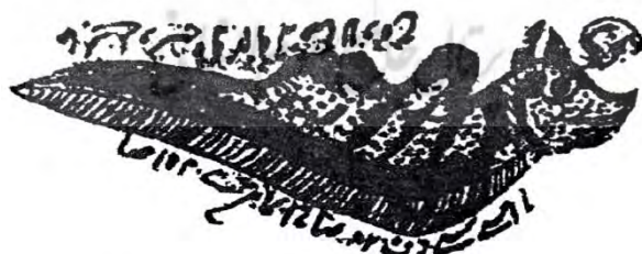
شکل ۴- کارکرد: درمان بی خوابی