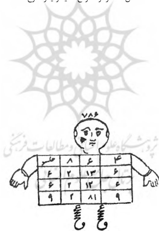
شکل ۲- کارکرد : ایمنی و سلامتی در وضع حمل