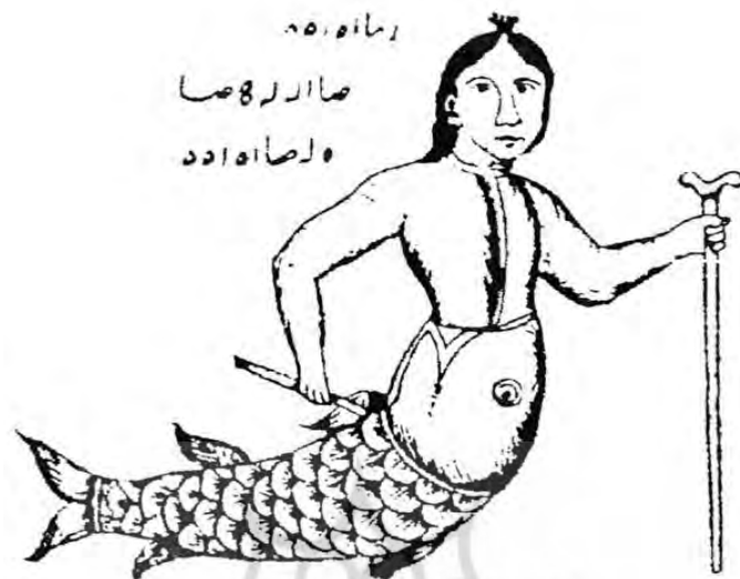
شکل ۳- کارکرد: رفع درد و شفای مریض