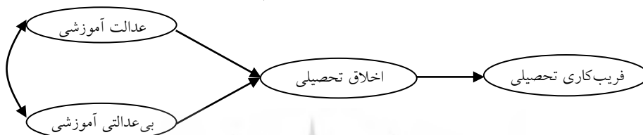
شکل ۱. مدل نظری پژوهش در باب رابطه عدالت و بی‌عدالتی آموزشی با فریبکاری تحصیلی با توجه به نقش اخلاق تحصیلی

بی‌عدالتی آموزشی معکوس می‌شود. از نظر اهمیت، یافته‌های پژوهشی از نوع پژوهش حاضر، بستر را برای کاربردی‌سازی یافته‌ها در محیط‌های تحصیلی و دانشگاهی برای تضعیف رفتارهای منفی دانشجویان فراهم خواهد ساخت. بنابراین هدف اصلی این پژوهش آزمودن برازش مدل ارائه شده در شکل ۱ با داده‌های حاصل از پژوهش است، تا از آن طریق زمینه بسط و گسترش دانش کنونی در باب نقش‌های عدالت و بی‌عدالتی آموزشی همراه با اخلاق تحصیلی برای فریبکاری تحصیلی فراهم آید.