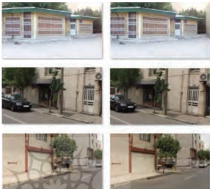
نگاره ۳: تصاویر چپ و راست اخذ شده از محیط توسط دوربین استریوی Fuji W3

روی هم قرار گرفته و می‌توان تصویر آناگلیف تولید نمود و چشم انسان قابلیت برجسته بینی آن را نیز به راحتی دارد.