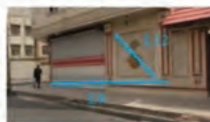
نگاره ۶: برخی طول‌های چک اندازه‌گیری شده در محیط