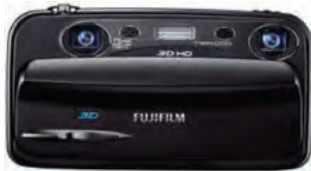
نگاره ۱: دوربین استریوی W3، به عنوان یک نمونه از دوربین‌های استریو

انتقال و سه دوران) به عنوان مقادیری ثابت در تسهیل و اتوماسیون تولید مدل بصری و همچنین استخراج اطلاعات هندسی محیط بهره گرفت.