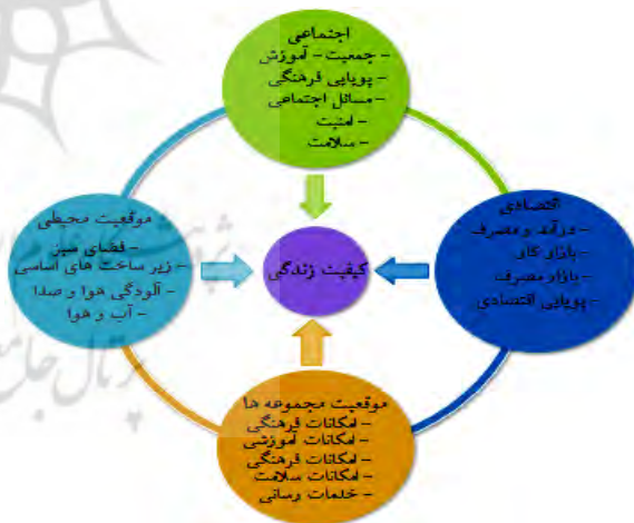
شکل ۱. نمودار شاخص‌ها و متغیرهای سنجش کیفیت زندگی شهری

محققان حوزه کیفیت زندگی معتقدند که شاخص‌های ذهنی، قدرت تبیین بیشتری دارد، در حالی که شاخص‌هایی که بصورت عینی شرایط زندگی را می‌سنجند، فقط می‌توانند حدود ۱۵ درصد از کیفیت زندگی فرد را تبیین کنند (Ghafari et al, 2009: 4).