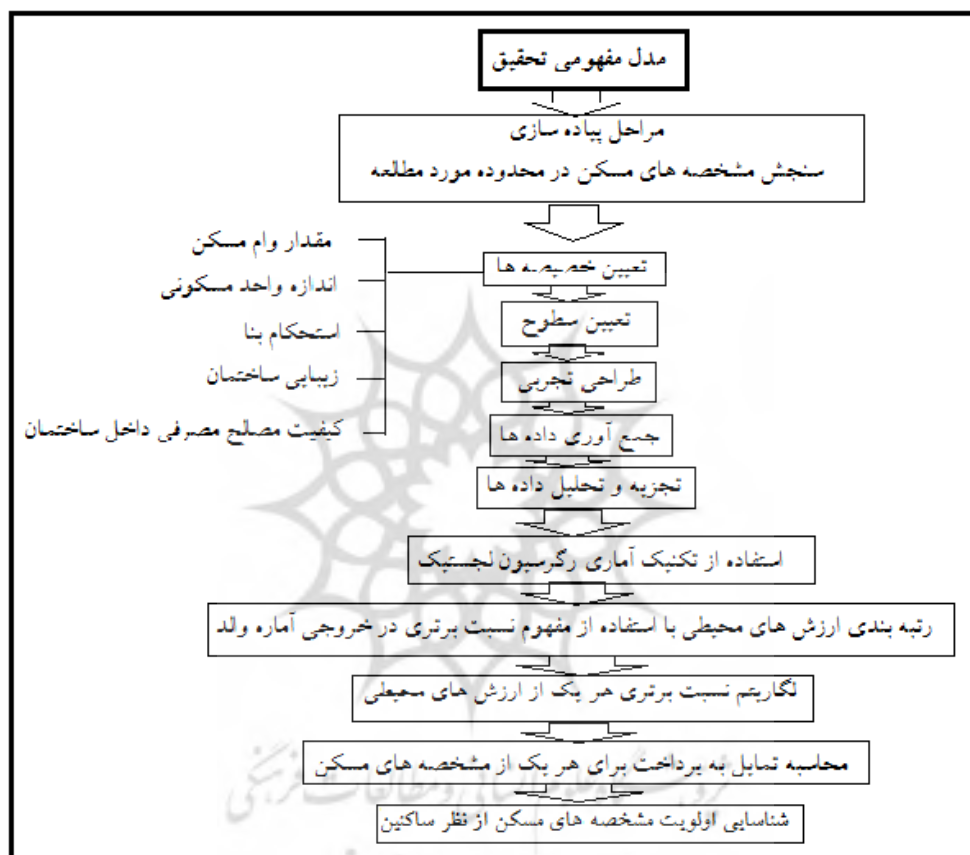
نمودار ۱. مدل مفهومی تحقیق

مصاحبه کننده پس از توضیح مشخصات دو گزینه از فرد می‌خواهد که با توجه به مشخصات واحد مسکونی، از بین دو گزینه یک گزینه را انتخاب کند. این ۸ سناریو به سه قسمت تقسیم شد و در هر روستا ۳۰ پرسشنامه پر شد. در ۲۰ مورد از این ۳۰ پرسشنامه سوالات ۳ گزینه‌ای و ۱۰ مورد دیگر سوالات ۲