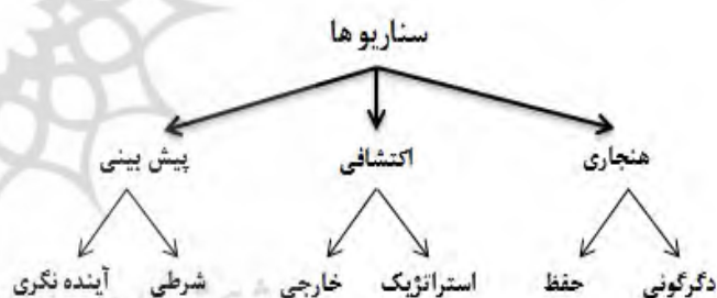
شکل ۱. گونه‌شناسی سناریوها، (Borjeson et al, 2006: 725)

سناریوها به یک افق زمانی طولانی‌تر و تغییرات عمیق‌تر نسبت به سناریوهای شرطی تمرکز دارند. سناریوهای اکتشافی نیز به دو نوع "خارجی" و "استراتژیک" قابل تفکیک هستند. «با توسعه عوامل خارجی چه اتفاقی می‌تواند بیفتد؟» این سؤالی است که بوسیله سناریوهای خارجی پاسخ داده می‌شود. هدف از سناریوی خارجی آن است که آمادگی برای توسعه در همه ابعاد مهیا شود. هدف از سناریوهای استراتژیک نیز توصیف طیف وسیعی از نتایج احتمالی تصمیم‌های استراتژیک است. این نوع سناریو به این سؤال پاسخ می‌دهد که «اگر ما برخی از راه‌ها را عمل کنیم، چه اتفاقی خواهد افتاد؟» در واقع سناریوهای استراتژیک بیشتر به اثر اعمال سیاست‌های مختلف توجه دارد. سناریوهای استراتژیک بر عوامل داخلی متمرکز است؛ اما سناریو بوجود آمده بین عوامل داخلی و خارجی در تعامل است (Hojer et al, 2008: 1960).