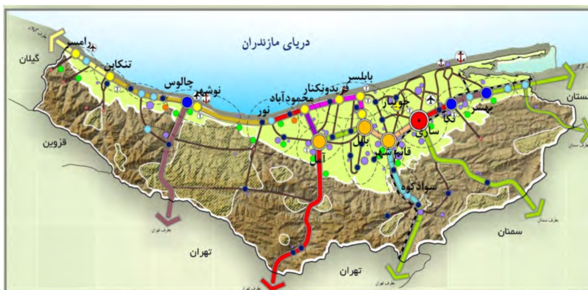
شکل ۳. سازمان فضایی استان مازندران،