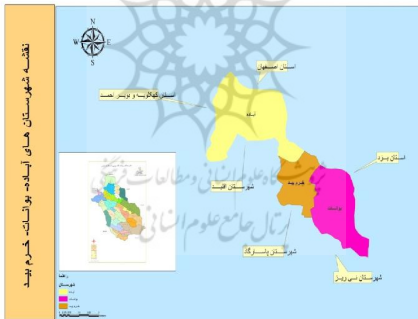
نقشه شماره ۱: شهرستان‌های آباده، بوانات و خرم بید

مطابق قانون تقسیمات کشوری و وظایف فرمانداران و بخشداران مصوب ۱۶ آبان ماه ۱۳۱۶، کشور ایران به ۶ استان و ۵۰ شهرستان تقسیم شد که شهرستان آباده به‌عنوان یکی از شهرستان‌های استان جنوب تشکیل گردید (Ghanbari, 2008: 125). با گذشت زمان شهرستان بوانات در سال ۱۳۷۴ و شهرستان خرم بید در سال ۱۳۷۶ از شهرستان آباده منتزع و به‌عنوان شهرستان‌های جدید استان فارس تشکیل شدند که در بخش به معرفی شهرستان‌های مورد مطالعه پرداخته می‌شود.