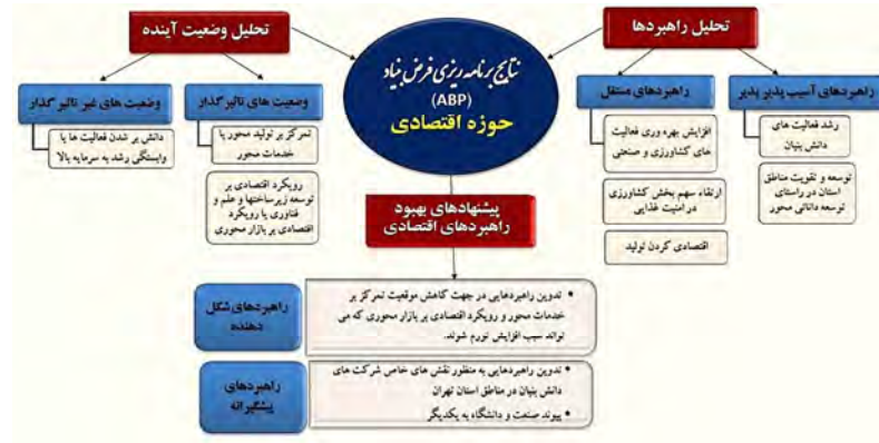
شکل ۴ تحلیل نتایج برنامه‌ریزی فرض بنیاد حوزه اقتصادی