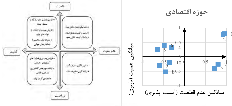
شکل ۲ نمودار اهمیت-فقدان قطعیت شکل ۳ فضای دو بعدی اهمیت-فقدان قطعیت (باربری-آسیب‌پذیری)