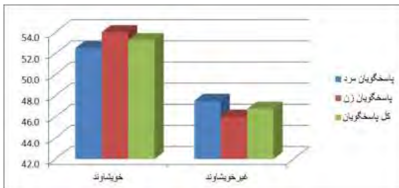
نمودار ۲- توزیع پاسخگویان بر حسب متغیر نسبت با همسر

نمودار ۳ نشان می‌دهد که مردان بیشتر در بازه سنی ۲۹-۲۵ سال ازدواج می‌کنند و فقط ۲٫۵ درصد آنها در سنین کمتر از ۲۰ سال ازدواج می‌کنند، اما بیشترین ازدواج زنان در بازه سنی ۲۰-۲۴ سال اتفاق می‌افتد و حدود ۲۰ درصد زنان در سنین کمتر از ۲۰ سالگی ازدواج می‌کنند.