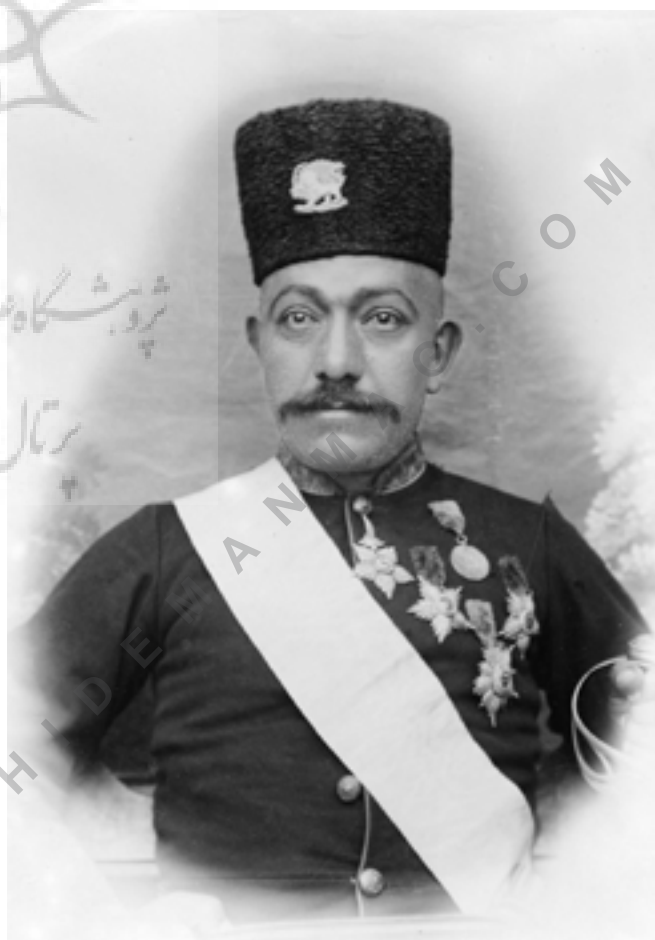
رستم شاه جهان، این عکس مربوط به اواخر عهد قاجار هست حدود ۱۲۹۸ یا ۱۲۹۹ شمسی، در آن دوران، سنتی رایج شد که مردم با لباس حکام و شاهزادگان قاجار عکس یادگاری می گرفتند و رستم زخم خورده آن عهد بود؛ منبع: مجموعه عکس حسن نقاشی

شیراز پژوهشگاه علوم انسانی و مطالعات فرهنگی مركز چاپ و نشر مركز چاپ و نشر