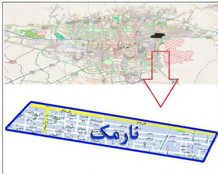
نقشه ۱- اطلاعات کل محدوده

می‌شناسند؛ در واقع، بزرگراه رسالت باعث تغییر و جدایی قابل توجهی در این محلّه شد. قسمتی که در منطقه ۴ شهرداری قرار گرفته، در حال حاضر از شمال به خیابان فرجام، از جنوب به بزرگراه رسالت، از شرق به بزرگراه شهید باقری و از جهت غرب به خیابان هنگام ختم می‌شود. محلّه نارمک از شمال با محلّه علم و صنعت، از جنوب با منطقه ۸ شهرداری تهران، از طرف شرق با محلّه کالاد، همسایه است. محلّه نارمک به دلیل داشتن میدان‌های سرسبز و خیابان‌بندی‌های منظم، شناخته شده است. میدان اصلی نارمک با نام فعلی نبوت، مرکز اصلی و نشانه این محلّه است. این میدان دارای هفت حوض متصل به هم است و از این‌رو در گذشته آن را میدان هفت حوض می‌خواندند. همچنین سایر اطلاعات پایه‌ای و نقشه مناطق تهران و محلّه نارمک در نقشه ۱ و جدول ۲ نشان داده شده است. در جدول ۳، وضعیت فعلی محدوده براساس تکنیک SWOT، ارزیابی شده است.