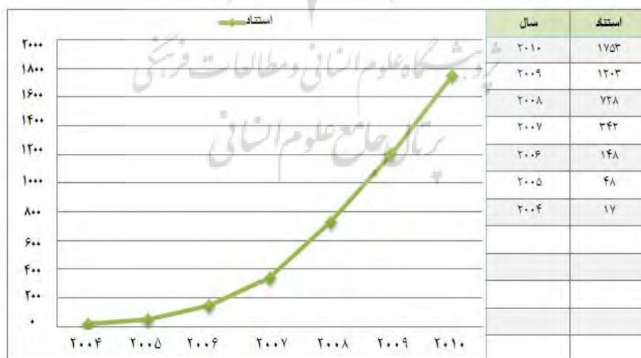
نمودار: ۱: توزیع فراوانی میزان استناد به تولیدات علمی پژوهشگران دانشگاه علوم پزشکی اصفهان در پایگاه Scopus

سال ۲۰۰۴ میلادی به ۱۷۵۳ بار استناد در سال ۲۰۱۰ میلادی رسیده است. لازم به ذکر است که از مجموع ۱۸۳۰ عنوان مدرک نمایه شده مربوط به پژوهشگران این دانشگاه در پایگاه مذکور تعداد ۵۷۴ مدرک (۳۱/۴ درصد) هیچ استنادی را دریافت نکرده است و سایر مدارک نیز جمعا ۴۱۲۹ بار استناد دریافت کرده است، البته میانگین و متوسط بیش از دو استناد به ازای هر مدرک در بازه زمانی مورد بررسی نشان از رشد مثبت استنادات در این سال‌ها می‌باشد، به نحوی که در جدول ۱ مشاهده می‌شود تعداد آن از ۷۴/۰ بار استناد برای هر مدرک در سال ۲۰۰۴ به ۳/۹ بار استناد برای هر مدرک در سال ۲۰۱۰ رسیده است و نهایتا با میانگین و متوسط ۲/۳۳ بار استناد برای هر مدرک در مجموع نشان از روند مطلوب و رشد استنادات دارد. در بعد جغرافیایی استنادکنندگان یافته‌ها نشان داد بیشترین تعداد استنادات دریافتی با ۱۰۴۷ بار، توسط پژوهشگران داخلی انجام شده است، اما در بین سایر کشورها ایالات متحده آمریکا با ۹۱۷، و سپس انگلستان و چین به ترتیب با ۲۹۸ و ۲۲۱ بار استناد جزو کشورهای شاخص استناد کننده به مقالات پژوهشگران این دانشگاه محسوب می‌شوند. نتایج نشان می‌دهد بیشترین تعداد مقالات نمایه