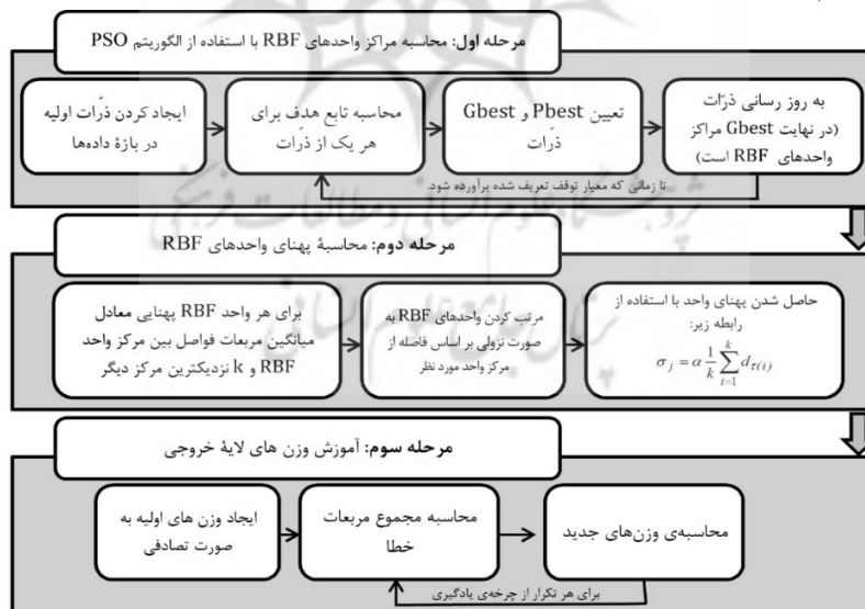
شکل ۲. دیاگرام آموزش سه مرحله‌ای شبکه عصبی تابع پایه شعاعی

همان‌طور که در شکل ۱ مشاهده می‌شود مدل ارائه‌شده به‌منظور مدل‌سازی دانش یادگیرندگان از سه بخش اصلی داده‌های تحقیق، روش پیشنهادی تحقیق و خروجی مدل تقسیم می‌شود که در ادامه به تشریح هر یک از بخش‌ها پرداخته خواهد شد. مدل پیشنهادی آموزش سه مرحله‌ای شبکه عصبی تابع پایه شعاعی: آموزش شبکه در سه مرحله انجام می‌گیرد که به‌صورت دیاگرامی در شکل زیر نشان داده شده است: