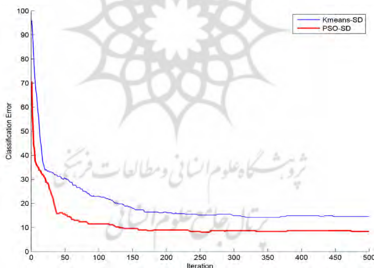
شکل ۴. نمودار خطای دسته‌بندی حل مسئله تحقیق

پیاپی سازی واقعی و اعتبارسنجی مدل پیشنهادی: به منظور ارزیابی مدل پیشنهادی و به کارگیری آن در دوره‌ای جدید ۶۹ نفر از یادگیرندگان در نظر گرفته شده‌اند. این افراد