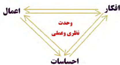
شکل ۱: کارکرد اجتماعی دین

به تدریج این مفهوم از زمان مسافرت دریایی اروپایی‌ها به سایر سرزمین‌ها و کشورها از فضای تعریف یک طبقه به سمت تعریف ویژگی یک جامعه پیشرفت. اروپایی‌ها ناچار بودند برای ماندن در کشورهای مستعمره، زبان و آداب آن‌ها را بشناسند. آن‌ها می‌دیدند چیزی در کشورهای خود دارند که در کشورهای مستعمره نیست و اسم آن‌را فرهنگ گذاشتند و لذا به مرور، اسم جوامع خود را با فرهنگ گذاشتند و جوامع استعمار شده را «عقب‌مانده» نامیدند. در پی این جریان بود که به مرور زمان مفهوم فرهنگ به یک مفهوم هنجاری و دو دسته‌ساز