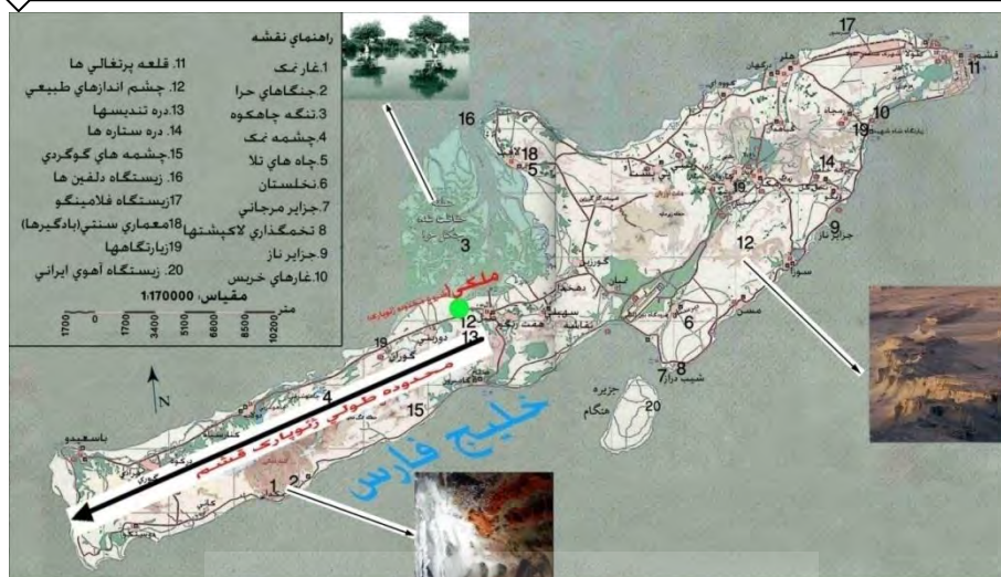
نقشه شماره (۲): سایتها و مکانهای گردشگری در جزیره قشم

با توجه به سایتهای گردشگری بکر و طبیعی در جزیره قشم یکی از مهمترین اهداف تشکیل منطقه آزاد در این جزیره در زمینه گردشگری، شکوفایی و بالفعل نمودن سایتها و مکانهای گردشگری است.