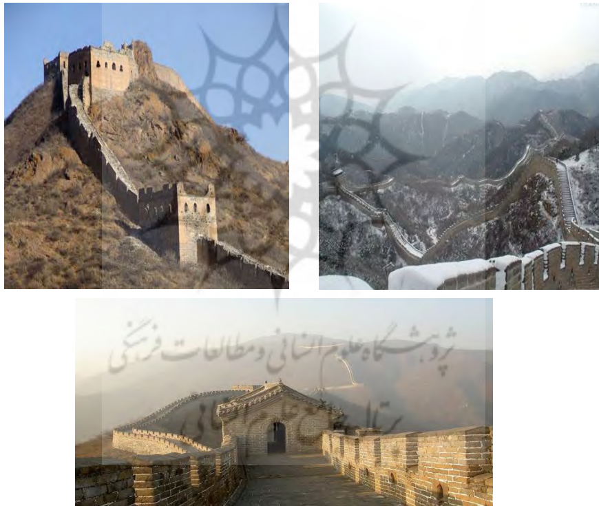
تصویر شماره ۱: دیوار چین

دیوار چین یکی از هفت اعجاز جهان است و به لحاظ زمان ساخت، طولانی‌ترین و بزرگترین مهندسی تدافعی نظامی قدیم را دارد و نشان می‌دهد که از گذشته‌های دور نیز در زمینه‌ی واپایش مرزهای کشور از طرح انسداد مرزی برای مقابله و جلوگیری با ناامنی‌ها ناشی از فراسوی مرزها به داخل کشور استفاده می‌شده است. در زیر چند عکس از این طرح انسداد مرزی آورده شده است.