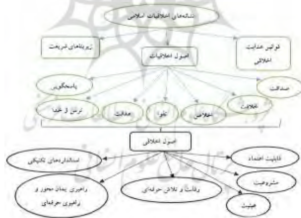
شکل (۱). چارچوب مفهومی کدهای اسلامی اخلاقیات AOIFI

با این وجود برخی محققین به کددهی اخلاقیات که بیشتر گفته شد به دلایل مختلف واکنش مطلوبی نشان نداده‌اند. عبدالرحمن (۲۰۰۳) بیان می‌دارد که داشتن یک اصل اخلاقی برای اخلاق‌مدار کردن حسابداران کافی نیست. وی اضافه می‌کند که مطالعات