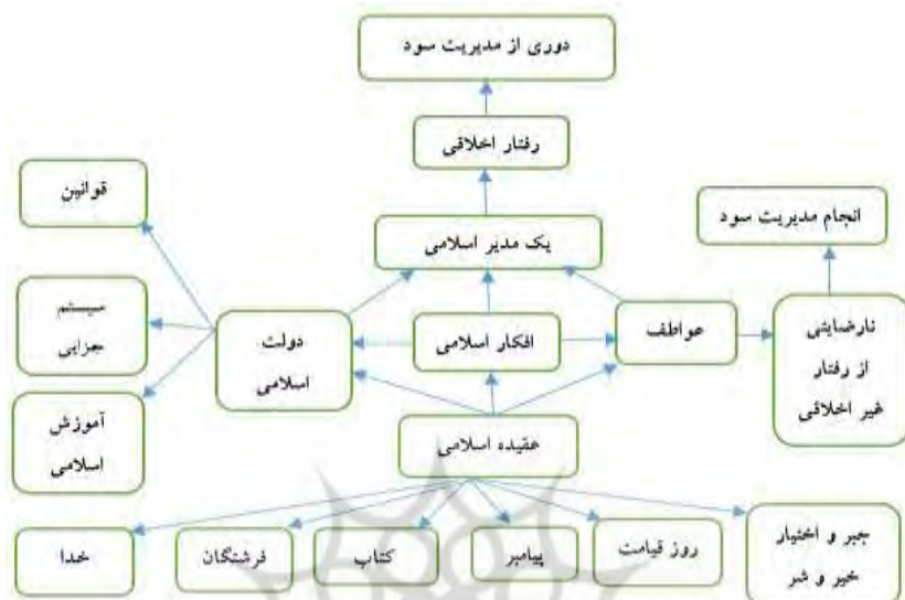
شکل (۳). چارچوب ساختاری عقیده اسلامی بر انجام مدیریت سود

براساس شکل ۳ عقیده سه زیر شاخه دارد، شامل عواطف، افکار و دولت ( Normala & Demikha, 2011). با شروع از عواطف عقیده اسلامی احساسات عاطفی را نسبت به هر حرکت یا هدفی با تولید رضایت یا عدم رضایت تعیین خواهد نمود. در مورد مدیریت سود احساس مورد انتظار از یک مدیر اسلامی یک جواب منفی به انجام مدیریت سود مذموم (فرصت طلبانه و سوداگرایانه) به خاطر نقض توافق بین مالکان شرکت و نمایندگان آنها (مدیران) خواهد بود. جزء دوم، دولت اسلامی است که به موجب آن قوانین باید به منظور محدود نمودن عمل متقلبانه در شرکت‌ها در کنار یک سیستم جزائی که عملکردهایش به عنوان حصار از اقتصاد و ثروت ملت است، به تصویب برسد. این حاصل نمی‌گردد مگر با داشتن سیستم آموزشی اسلامی که نسلی تولید کند که به دکترین اسلامی احترام می‌گذارد و به آن پایبند است. بعد از گذاشتن تمام این اجزاء در جای خود گفته می‌شود که یک فرد اسلامی به جامعه تحویل گردیده و به عمل مدیریت سود به عنوان عملی غیرقانونی و حرام نگریسته خواهد شد. در حقیقت