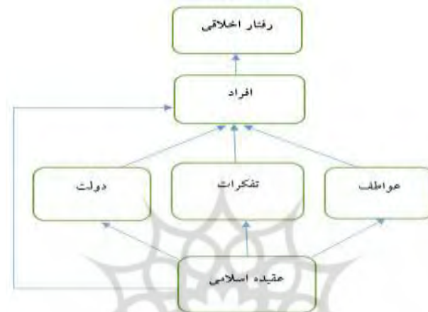
شکل (۲). چاروب ساختاری یک رفتار اخلاقی در اسلام

این شکل بیان می‌کند که یک مدیر مسلمان بخاطر صداقت خودش با صداقت توصیف نمی‌شود بلکه بخاطر فرمان خداوند این فضیلت را در می‌یابد. فهم این مسأله مهم است که فردی که از رفتارهای اخلاقی خوب برخوردار است اما عقیده اسلامی ندارد نمی‌تواند به عنوان یک فرد اخلاقی نگریسته شود یا به عبارت دیگر ارزش‌های اسلامی را ندارد زیرا اساساً وی فردی غیرمعتقد است. به همین ترتیب شخصی که رفتارهای اخلاقی خوبی دارد اما خدا را عبادت نمی‌کند نیز چنین شخصیتی دارد، عقیده مستلزم عمل به آن است (Normala & Demikha, 2011).