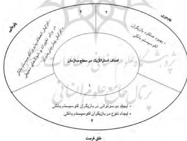
شکل ۴ اهداف استراتژیک نهایی در سطح اکوسیستم کسب‌وکار

از مهم‌ترین نتایج پژوهش حاضر می‌توان به شناسایی و تبیین پنج هدف استراتژیک در سطح اکوسیستم کسب‌وکار بانکی اشاره کرد. علاوه بر هدف اصلی این تحقیق که نوآوری آن نیز محسوب می‌شود، از دیگر دستاوردهای این تحقیق می‌توان به آشنا کردن مدیران ارشد نظام بانکی کشور با مفهوم «اکوسیستم کسب‌وکار» با توجه به جدید بودن آن و تلاش برای ایجاد تغییر در طرز فکر و افزایش تعامل آنها با سایر بازیگران اکوسیستم بانکی به منظور بهبود عملکرد هریک از بانک‌های کشور نام برد.