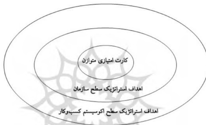
شکل ۱ اهداف استراتژیک در سطح اکوسیستم کسب‌وکار

داشتن توانایی برای تغییر شکل و دگرگونی در زمانی است که محیط تغییر می‌کند. همچنین اکوسیستم کسب‌وکار باید توانایی خلق فرصت‌ها و بازارهای گوشه برای سازمان‌های جدید را داشته باشد. این امر مستلزم تغییر در نگرش‌ها از حمایت‌گرایی به همکاری مشارکتی است [۹، ص ۲۴۸] تکامل مشارکتی نمی‌تواند در یک محیط ایزوله رخ دهد بلکه درون اکوسیستم و از راه تلفیق نوآوری‌های باز ۲۱ و بسته ایجاد خواهد شد [۲۵، ص ۱۲؛ ۲۶، ص ۱۷].