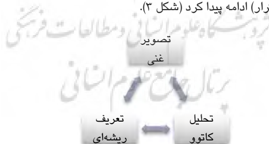
شکل ۳ رویکرد چرخه‌ای در ساختار بندی مسئله (سه مرحله اول SSM)

در SSM مرحله اول و دوم کاملاً در دنیای واقعی و به منظور ترسیم وضعیت موجود قرار دارند. در مرحله سوم با ارائه تحلیل کاتوو و تعریف ریشه‌ای سعی می‌شود تا چارچوب کلی برای طراحی وضع مطلوب طرح شود. در این تحقیق پس از برگزاری جلسه‌های متعدد با ذینفعان مسئله، نخست تصویر غنی ترسیم شده و پس از دریافت بازخوردهای اصلاحی، آنالیز کاتوو و تعریف ریشه‌ای از سیستم مراقبت یکپارچه (به عنوان راه‌حلی برای کنترل سرطان شغلی) ارائه شد. سپس براساس تعریف به دست آمده، تصویر غنی و عناصر کاتوو بازنگری و اصلاح شده و در نتیجه تعریف ریشه‌ای تعدیل شد. این چرخه تا رسیدن به اجماع میان کارفرما و محققان (سه بار تکرار) ادامه پیدا کرد (شکل ۳).