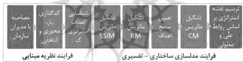
شکل ۱ فلوجارت مراحل اجرای تحقیق

است که آیا رابطه‌ای بین عناصر وجود دارد؟ و در صورت مثبت بودن جواب، ارتباط آنها چگونه است؟ از طرف دیگر مدلی ساختاری است، به این معنا که در آن بر مبنای روابط، ساختاری کلی از مجموعه پیچیده عناصر اقتباس می‌شود و در نهایت مدل‌سازی است؛ یعنی اینکه روابط عناصر و ساختار کلی در یک مدل گرافیکی مجسم می‌شود [۲۴، صص ۵۲ - ۵۹]. در اجرای تکنیک ISM، شش مرحله باید انجام شود. نخست به تعیین ابعاد / عناصر پرداخته و سپس ماتریس ساختاری روابط درونی ابعاد / عناصر (SSIM) به دست می‌آید. پس از آن ماتریس دستیابی استخراج شده و در مرحله بعد ماتریس دستیابی سازگار می‌شود. سطح‌بندی عناصر ماتریس دستیابی مرحله بعد است و در نهایت مدل ترسیم می‌شود. پرسشنامه این پژوهش به ۱۶ نفر از خبرگان ارسال شد. محقق با پیگیری‌های مکرر ۱۰ پرسشنامه تکمیل شده را دریافت کرد. برخی از خبرگان درباره پرسشنامه و نحوه پاسخ‌گویی به آن ابهاماتی داشتند که سعی شد در تماس تلفنی و یا مراجعه حضوری، ابهام‌ها مرتفع شود. مراحل اجرای این پژوهش در فلوجارت ذیل آمده است.