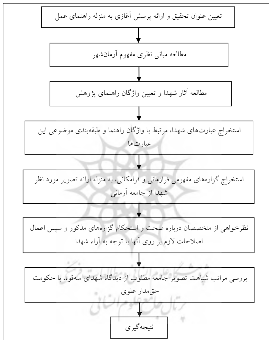
نمودار ۱. سیر منطقی جریان پژوهش