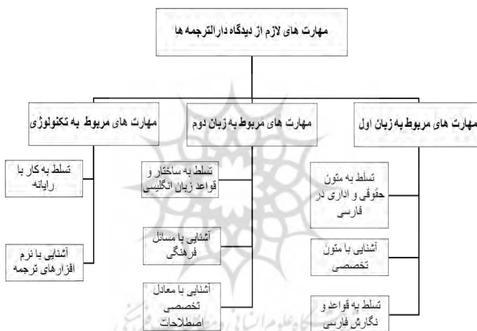
شکل ۱. مهارت‌های لازم از دید دارالترجمه‌ها

گرفته پس لابد ترجمه‌اش خوب است. این دسته از فارغ‌التحصیلان نسبت به آموزش و کارآموزی تحمل کمی دارند؛ حال آنکه فردی که آموزش رسمی مترجمی ندیده علاقه بیشتری برای یادگیری از خود نشان می‌دهد. در ادامه چکیده‌ای از مهارت‌های لازم از دید دارالترجمه‌ها در شکل شماره یک قابل مشاهده است.