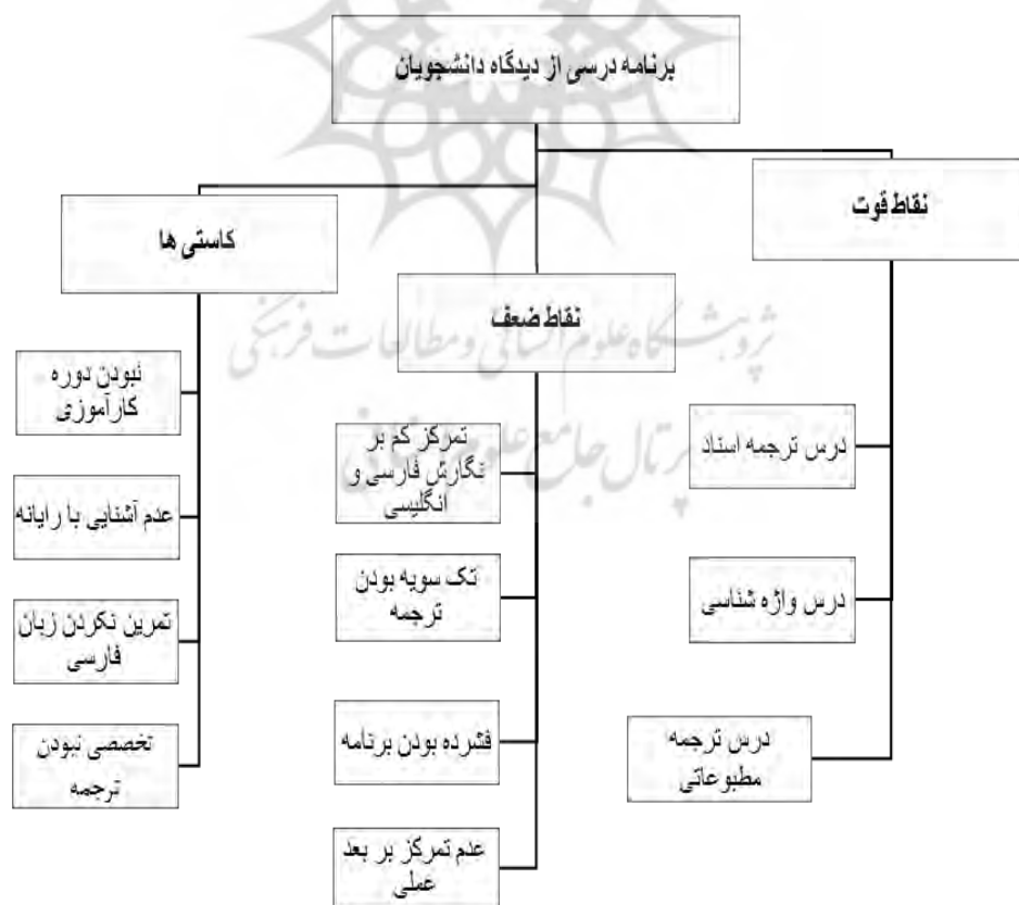
شکل ۲. تحلیل برنامه درسی از دید دانشجویان

اکثر دانشجویان بر این باورند که در برخی مهارت‌های زبانی مانند: گرامر و مکالمه ضعیف هستند و علت این ضعف تمرکز و تأکید کم برنامه درسی بر این مهارت‌ها است، بهتر است دو سال اول به تقویت مهارت‌های زبانی پرداخته شود و دو سال آخر، دروس تخصصی ترجمه ارائه شوند. دانشجویان یکی از مشکلات را ناشی از مدت زمان کوتاه هر ترم می‌دانند که اکثراً هم با چند روز تعطیل همراه است و تا آن‌ها با اصول یک درس آشنا می‌شوند ترم به پایان می‌رسد و زمانی برای تمرین و تکرار آن درس باقی نمی‌ماند.