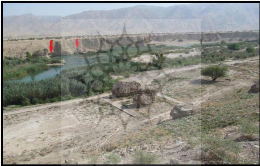
تصویر ۳. پل بند ارجان، محل انشعاب قنات‌ها از رودخانه (ر.ک. نگارندگان).

موقت نیز از آنجا به سمت بهبهان کوچ کردند. رشد بهبهان موجب فراموشی ارجان گردید و تمامی ظرفیت‌های ارجان در قالب شهر بهبهان به کار گرفته شد. در نهایت تمامی فعالیت‌های کشاورزی، تجاری و حتی مسیر جاده‌های ارتباطی به شهر بهبهان منتقل گردید و همین امر سبب شد که پس از آخرین دوره سکونت، ارجان هیچ‌گاه دوباره مورد استفاده قرار نگیرد. تأسیسات آبیاری ارجان تنقیه شد و مجدداً در شهرهای بهبهان و منصوریه به کار رفت. زمین‌هایی که شهر ارجان در آن‌ها قرار داشت، به زیر کشت غلات رفت و از ارجان جز نامی برجای نماند.