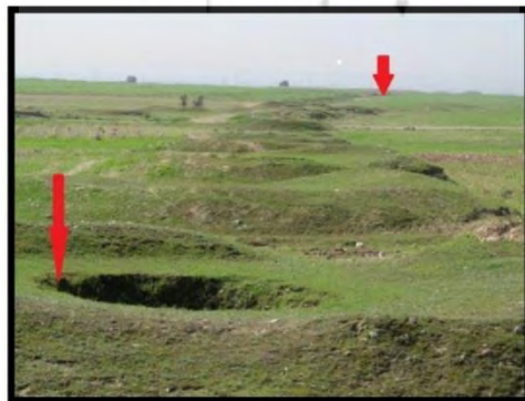
تصویر ۲. بخشی از سیستم آبیاری ارجان (ر.ک. نگارندگان)