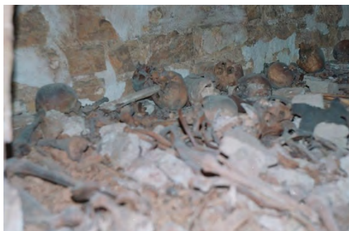
تصویر ۱. اسکلت‌های سوخته سردابه شاه غریب؛ عکاس: محمدتقی محمدی، سال ۱۳۷۴