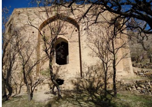
تصویر ۴. مقبره شاه غریب و درب سردابه؛ عکاس: رزا معماری، ۱۳۹۱