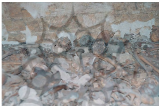
تصویر ۲. اسکلت‌های سوخته سردابه شاه غریب؛ عکاس: محمدتقی محمدی، سال ۱۳۷۴