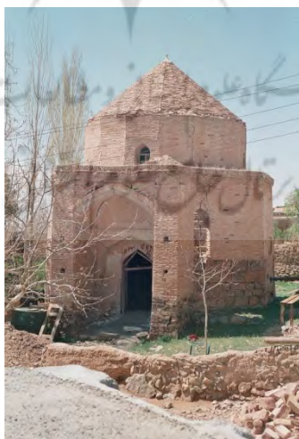
تصویر ۳. مقبره شاه قلندر؛ عکاس: محمدتقی محمدی، ۱۳۷۳