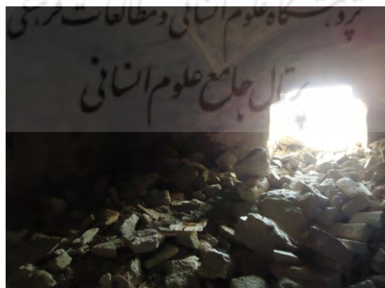
تصویر ۶. سردابه زیر مقبره شاه غریب، عکاس رزا معماری، ۱۳۹۱