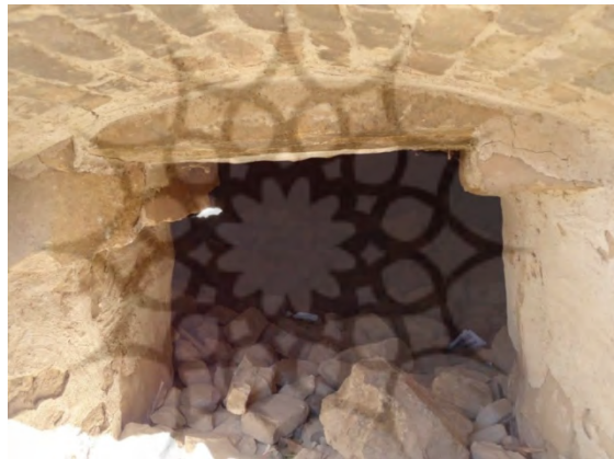
تصویر ۵. ورودی سردابه زیر مقبره شاه غریب؛ عکاس: رزا معماری، ۱۳۹۱