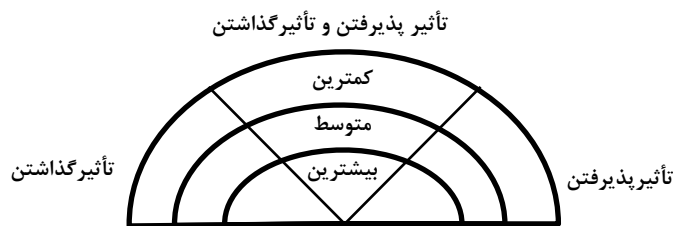
شکل ۱. نمودار رنگین کمان؛ تأثیرپذیری و تأثیرگذاری ذی‌نفعان بر یک برنامه یا اقدام

پس می‌توان گفت که ذی‌نفع، «فرد یا گروهی از افراد هستند که قدرت تأثیرگذاری در برنامه، پروژه یا فعالیت مشخصی را دارند یا از آنها تأثیر می‌پذیرند» (شکل ۱).