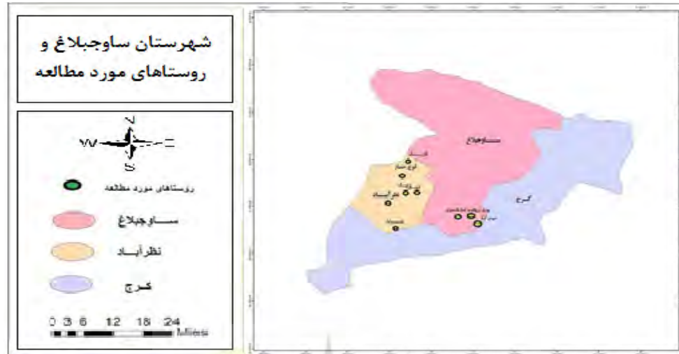
شکل ۱- موقعیت روستاهای مورد مطالعه در شهرستان ساوجبلاغ