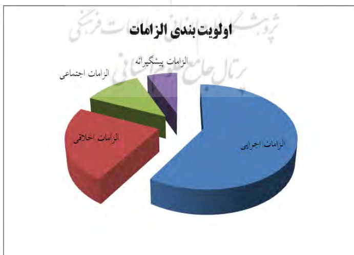
نمودار ۲- اولویت بندی الزامات