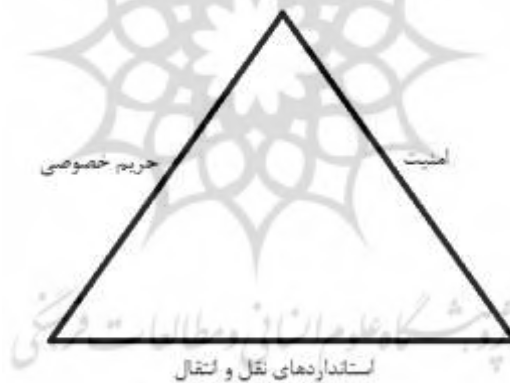
شکل ۳. مثلث HIPAA (کلندر، ۲۰۱۳)

سومین مؤلفه مهم در مدل ارائه‌شده در Error! Reference source not found. ، حریم خصوصی، امنیت و قابلیت اطمینان است (حفاظت). با توجه به ماهیت داده مراقبت سلامت، پایداری به استانداردهای کافی در این زمینه برای رسیدن به موفقیت نهایی در ارائه سلامت همراه ضروری است. در کشور آمریکا، امنیت، حریم خصوصی و استانداردهای مربوط به انتقال و ارائه الکترونیکی اطلاعات مراقبت سلامت تحت پوشش HIPAA ۲ هستند. می‌توان این مورد را به‌عنوان مثلث HIPAA در نظر گرفت که عناصر اساسی نظارتی HIPAA یعنی امنیت، استانداردهای نقل و انتقال و حریم خصوصی را به‌صورت برجسته نمایش می‌دهد شکل ۳. (کلندر، ۲۰۱۳)