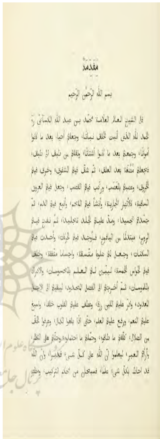
شکل 2: تصویر صفحه مقدمه چاپی ایزنبرگ