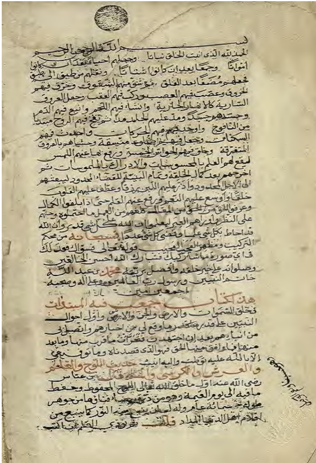
شکل 1: تصویر صفحه آغازین نسخه خطی کتابخانه مرکزی دانشگاه تهران به شماره 9893