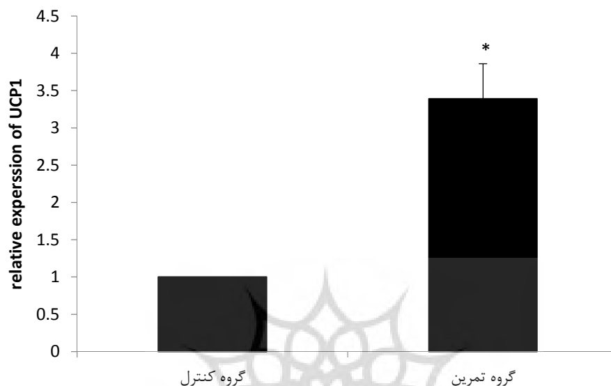
شکل ۳- میزان تغییرات بیان نسبی mRNA ژن UCP1 در گروه تمرین ( 3/39 \pm 0/47 ) و کنترل * معناداری در سطح P < 0.001