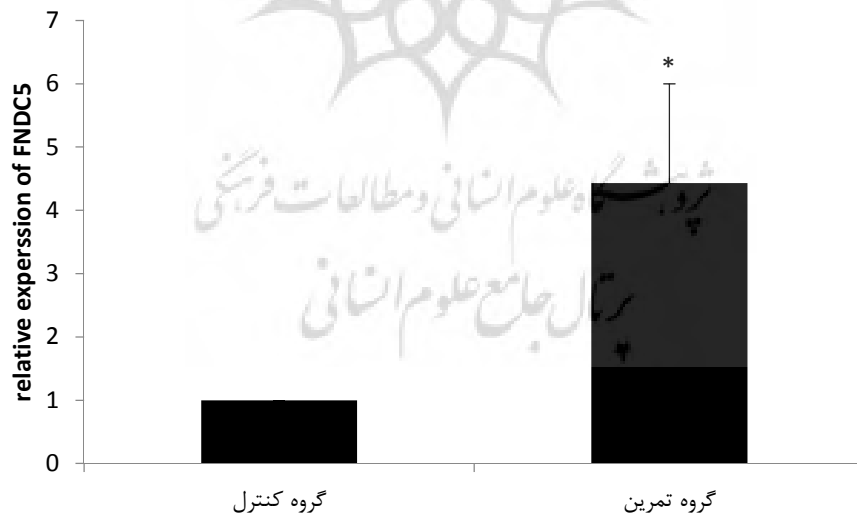
شکل ۲- میزان تغییرات بیان نسبی mRNA فن FNDC5 در گروه تمرین (4/43 ± 1/57) و کنترل * معناداری در سطح P<0.001