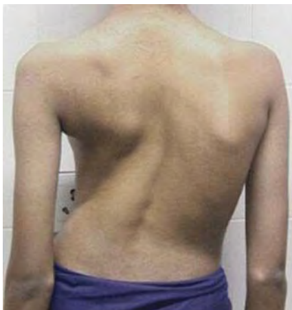
شکل ۱. نمونه‌ای از فرد دچار اسکولیوزیس ساختاری

در زمینه ارتباط ناهنجاری‌های بدنی و مسائل روانی تحقیقات اندکی صورت گرفته است. در همین راستا پاینه و همکاران (۱۹۹۷) تحقیقی با عنوان «عوارض روانی اسکولیوزیس» انجام دادند. در این تحقیق افراد دچار اسکولیوزیس با افراد سالم ۱۲ تا ۱۸ ساله مقایسه شدند. نتایج حاکی از آن بود که افراد دچار اسکولیوزیس تصویر بدنی ضعیف‌تری نسبت به افراد سالم داشتند. همچنین افراد دارای اسکولیوزیس تمایل بیشتری به خودکشی و مصرف الکل بیشتر نشان دادند و نگرانی زیادی در مورد رشد غیرطبیعی بدنشان نسبت به افراد سالم داشتند (۱۷). وید (۲۰۰۶) تحقیقی با عنوان «تصویر بدنی و عزت نفس در افراد دارای اسکولیوزیس و افراد سالم» انجام داد. در این تحقیق ۳۹ نوجوان دارای اسکولیوزیس با ۴۷ نوجوان سالم (رده سنی ۱۵ تا ۱۸ سال) مقایسه شدند. نتایج نشان داد افراد دچار اسکولیوزیس تصویر بدنی بهتر و عزت نفس بیشتری نسبت به گروه کنترل داشتند. نتیجه این تحقیق با یافته‌های قبلی متناقض بود (۲۵).