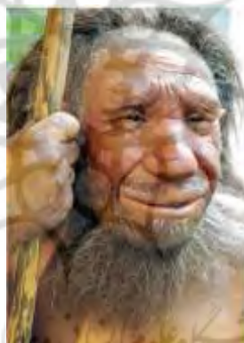
آیا نئاندرتال‌ها در جریان تکامل خود صاحب بینی‌های بزرگ شدند تا بتوانند در هوای سرد عصر یخبندان به آسانی نفس کنند؟

بسیاری از دیرین‌انسان‌شناسان بر این اندیشه‌اند که فیزیک نئاندرتال‌های قدیمی برای سازگاری با شرایط سرد آب و هوایی اروپا، در طول یخبندان‌های پلیستوسن تکامل پیدا کرد. برخی حتی بر آنند که بینی‌های پهن و بزرگ نئاندرتال‌ها حاصل نوعی سازگاری با سرما بوده است. سوراخ‌های گشاد بینی، ممکن است توانایی آنها را برای گرم کردن هوای سرد، پیش از کشاندن آن به درون ریه‌ها افزایش داده باشد» (Steffoff, 2009: 68-69).