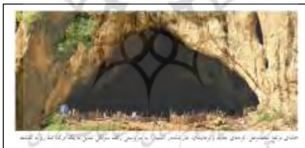
شکل ۱: خانه‌ای مرتفع مخصوص کردهای جدید و بزهایشان. غار شاندر در (شانیدر) به سرپرستی رالف سولکی تبدیل به درگاهی شد که رو به گذشته باز شد.

بیشترین مدارک دال بر اینکه دست کم برخی از نئاندرتال‌ها از هم‌نوعان ناتوان خود پرستاری می‌کرده‌اند از شمال عراق به دست آمده است؛ همان‌جا که رودخانه زاب بزرگ در میان دره‌های زاگرس جریان دارد. بالای دیواره شیب‌دار دره شنیدر یک فضای باز وجود دارد که به یک غار بزرگ منتهی می‌شود. در سال ۱۹۵۱ یک باستان‌شناس آمریکایی به نام رالف سولکی ۱ ، منطقه را نقشه‌برداری کرد. او این غار را که هر زمستان به اشغال تعدادی از خانواده‌های بومی گرد و گله‌های آنها درمی‌آمد، به دقت بررسی کرد. هنگامی که سولکی یک گودال کوچک آزمایشی در کف غار کند، شواهدی مبنی بر اینکه از دوران پیش از تاریخ، انسان‌هایی در این غار می‌زیسته‌اند، پیدا کرد. در سال‌های بعد سولکی و یک تیم از دانشگاه کلمبیای نیویورک، همراه با دانشمندان عراقی و کارگران کرد، غار شنیدر را حفاری کردند. آنها در لایه‌های بالایی رسوبات، اجاق‌ها، ابزار و اجساد دفن شده مردمی را پیدا کردند که هر چند در هزاران سال پیش زندگی می‌کرده‌اند، از انسان‌های مدرن به شمار می‌رفتند. سپس در سال ۱۹۵۳ آنها بقایای تنها نئاندرتالی را که تا آن زمان در عراق کشف شده بود پیدا کردند، قطعاتی از اسکلت یک کودک. بعدها معلوم شد که غار شنیدر در بردارنده نه اسکلت نئاندرتال است که عمر آنها بین ۴۰۰۰۰ تا ۷۰۰۰۰ سال تخمین زده می‌شود (Steffoff, 2009: 74-75).