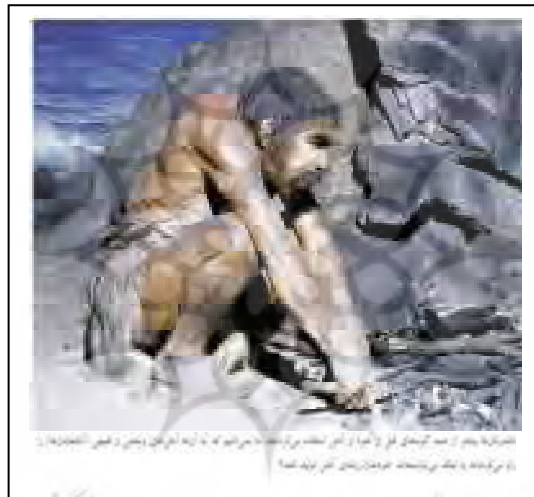
شکل ۴: نئاندرتال‌ها بیشتر از همه گونه‌های قبل از خود از آتش استفاده می‌کرده‌اند. ما نمی‌دانیم که آیا آن‌ها آتش‌های وحشی و طبیعی را رام می‌کرده‌اند یا این که می‌توانسته‌اند خودشان شعله آتش تولید کنند؟

۲۲ / پژوهش زبان و ادبیات فارسی، شماره سی و ششم، بهار ۱۳۹۴ برای در امان ماندن از سرمای استخوان سوز، علاوه بر پناه بردن به غارها، تمهیدات دیگری نیز لازم بوده از جمله لباس. «نئاندرتال‌ها همچنین ممکن است چوب را برای سوزاندن بریده یا تراشیده باشند. تحقیقات جدید نشان داده که در سردترین مناطقی که گمان می‌رفته نئاندرتال‌ها در آنجا زیسته باشند، بدن چاق به تنهایی نمی‌توانسته آنها را گرم نگه دارد. نئاندرتال‌ها در شرایط بسیار سخت آب و هوایی توانسته‌اند به کمک منابع تکنیکی و فرهنگی یعنی دانش و ابزار، زنده بمانند. آثار بجا مانده از اجاق‌های درون غارها و استخوان‌های سوخته نشان می‌دهد که آنها از آتش استفاده می‌کرده‌اند. اما آنها به لباس هم نیاز داشته‌اند. آنان احتمالاً پوست و خز حیوانات را تبدیل به لباس و روانداز می‌کرده‌اند. هر چند هیچ نشانی از این چیزها به دست نیامده است و هنوز هم کسی مدرکی نیافته که نشان دهد نئاندرتال‌ها برای خود سرپناه می‌ساخته‌اند (همان: ۸۱-۸۲).