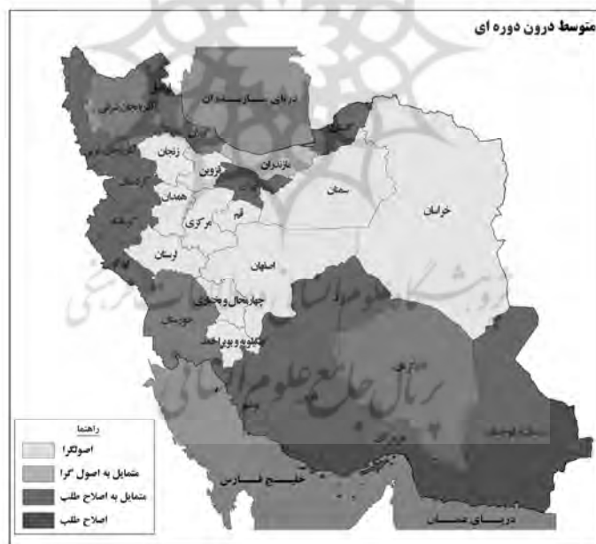
شکل ۲. پهنه‌بندی مشارکت سیاسی بین دوره‌ای

محاسبه شد و طبق روال پیشین برای محاسبه تفاضل‌ها در هر استان درصد مشارکت کاندید منتخب اصلاح‌طلبان از کاندید منتخب اصول‌گرایان کسر شد و اعداد تفاضل از بیشترین به کمترین مرتب و وسط طیف با آماره میانه محاسبه شد و اعداد بالای میانه گرایش، به اصلاح‌طلبی و اعداد پایین میانه نمایانگر گرایش به اصول‌گرایی بودند. لازم به ذکر است که در یک یا دو انتخابات اعداد کلیه استان‌ها منفی درآمدند. به عبارت دیگر، گرایش تمامی یا اکثر استان‌ها به اصول‌گرایی بوده که البته باز تفاضل‌ها محاسبه شدند. به سخن دیگر، بر اساس اعداد به دست آمده حتی در این دوره‌های خاص برخی اصول‌گراتر از بقیه بوده‌اند و برخی دیگر با وجود منفی بودن، اما گرایش جناحی آنها اصلاح‌طلبی بوده است. این مورد درباره جدول پیشین (مشارکت بین دوره‌ای) نیز وجود دارد. همان‌طور که در جدول ۷ و ۸ آمده، در کنار ستون اعداد تفاضل برای هر دوره ستون میانه قرار دارد که جمع جبری میانه‌ها در آخرین ستون مبنای ترسیم پهنه‌بندی مشارکت درون دوره‌ای است که در ادامه آمده است.