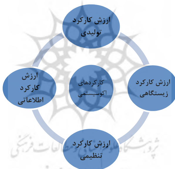
شکل ۲- انواع کارکردهای اکوسیستمی جنگل‌های بلوط استان ایلام

مشروط ۱ استفاده کرد. در روش ارزش‌گذاری مشروط از روش تمایل به پرداخت استفاده شد و در برآورد ارزش حفاظتی از تمایل به پرداخت افراد به یک سازمان مربوطه که در حفاظت از حیات وحش جنگل‌ها خبره بوده و قابل اعتماد است، استفاده شد. نتایج این پژوهش و پژوهش‌های قبلی نشان می‌دهد