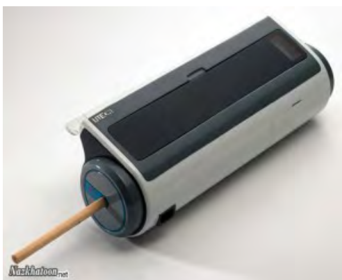
شکل (۱) نمونه ای از دستگاه کاغذ قلم کن