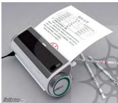
شکل (۲) نمونه ای از دستگاه کاغذ قلم کن