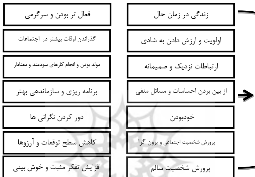
نگاره ۱: اصول چهارده گانه «فوردایس» جهت افزایش شادمانی (نیاز آذری، ۱۳۹۳: ۴۰)

فوردایس نیز دو جنبه ذهنی و عملی را در ایجاد شادی موثر می‌داند. وی هفت اصل را به حیطة ذهن و نوع تفکر و نگاه افراد به جهان پیرامون خود اختصاص داده و ۷ اصل دیگر که یک به یک متناظر با اصلی ذهنی ماقبل خود هستند، در حقیقت جنبه رفتاری و عملی همان اصل هستند. با این توضیحات به روشنی در می‌یابیم که نظر استرن (۲۰۱۰) به طور بارزی از نظرات فوردایس (صاحب‌نظر در حوزه روانشناسی شادی در سال ۱۹۹۷) تأثیر پذیرفته است.