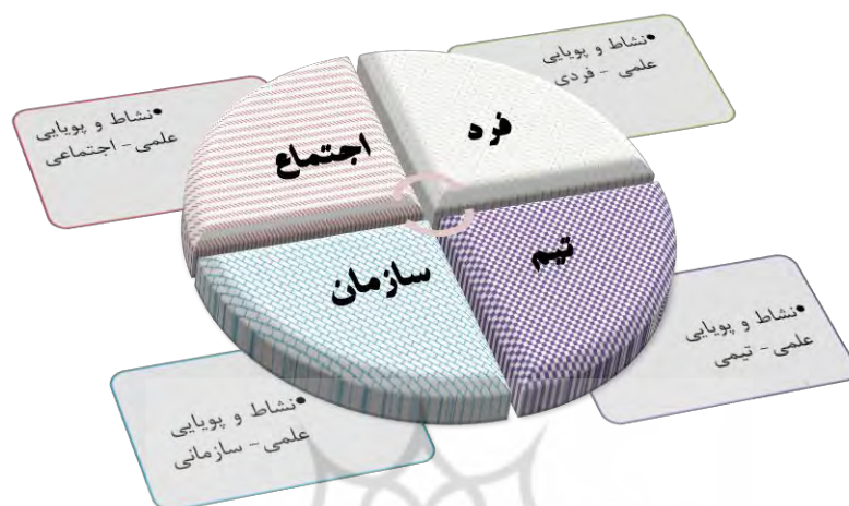
شکل ۱: ابعاد نشاط و پویایی علمی (برگرفته از یافته‌های پژوهش حاضر)

"پویایی علمی- فردی" را می‌توان اشتیاق و علاقه‌مندی فرد به مطالعه مستمر، پژوهش، یادگیری مادام‌العمر، حق‌خواهی، حق‌گستری، نقدپذیری، آینده‌نگری، ارزش‌آفرینی، اثرگذاری مؤلد و اثرپذیری ارزشمند در دانشگاه، جامعه، و جهان دانست؛ "پویایی علمی- تیمی" را می‌توان برخورداری از اشتیاق، پیشگامی، علاقه‌مندی و استقبال از مشارکت موثر و مؤلد در شکل‌دهی، شکل‌گیری، بهبود و همکاری در تیم‌های دانش‌بنیان، کارآفرین، ایده‌پرداز، و فعالیت‌های فرانتشی برای حضوری ارزش‌آفرین، حق‌محور، و تعالی‌بخش در تیم‌های علمی خودجوش و فداکار برای تحقق هدفی معین و ارزشمند، تعریف نمود؛ "پویایی علمی- سازمانی" را حرکتی هماهنگ، پرشتاب و هم‌جهت با اهداف علمی و آموزشی تعیین‌شده از سوی اسناد بالا دستی؛ نهادینه سازی فرهنگ مدیریت دانش، یادگیری سازمانی و تلاش برای تحقق سازمان یادگیرنده؛ ایجاد ارزش‌افزوده سازمانی و مدیریت موثر و یکپارچه سازی روندهای حرکتی فردی، تیمی و سازمانی؛ و "پویایی علمی- اجتماعی" را دغدغه، اشتیاق و ارج نهادن برای مشارکت‌دهی فرهیختگان، دانشجویان، اساتید، و سایر ارکان دانشگاهی در مسائل سیاسی، اقتصادی، فرهنگی، آموزشی و اجتماعی، بهره‌مندی از فرصت‌ها، ظرفیت‌ها و مزیت‌های دانشگاه، مراکز علمی و فرهیختگان و رفع مشکلات اجتماعی به‌منظور زمینه‌سازی برای تحقق آرمان جامعه شایسته‌پذیر، حق‌مدار، و دانشگاه جامعه - محور از طریق ارزش‌آفرینی، تولید ثروت، اقتدارآفرینی ملی و بین‌المللی، و تعامل‌سازنده در اثرپذیری و اثرگذاری متقابل، معنا کرد.