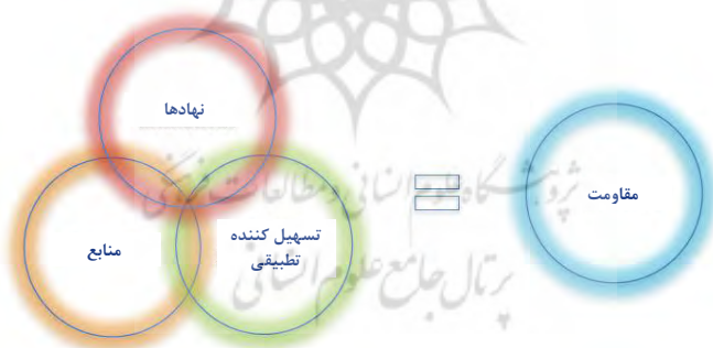
شکل ۲. حلقه‌های تحلیل مقاومت

سه حلقه در پایین شکل ۱ شامل نهادها، منابع و تسهیل‌کننده‌های تطبیقی هستند. این نمودار از سه دسته و ده عامل در درون آن تشکیل شده است که جامعه را از شوک‌های مختلف در هر زیربخش جدا می‌کند. درست همانند عایق یک خانه، این عوامل به جوامع کمک می‌کنند تا در مقابل شوک‌ها مقاومت نمایند و به وضعیت پیش از شوک‌ها برگردند. این عوامل مقاومتی از حلقه‌های بازخوردی منفی که به وسیله شوک‌ها در سیستم پیچیده ایجاد می‌شوند، جلوگیری می‌کنند و حلقه‌های بازخوردی مثبت را ایجاد و دائمی می‌کنند تا سازگاری و بهبودی را افزایش دهند. در ادامه به معرفی دقیق‌تر این حلقه پرداخته می‌شود (شکل ۲). ۱