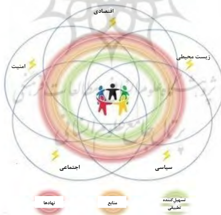
شکل ۱. رویکرد سیستم ترکیبی تحلیل مقاومت

همپوشانی دایره‌ها در زیربخش‌ها نشان می‌دهد که زیربخش‌ها به یک روش پیچیده غیرخطی به هم مرتبط‌اند. یک شوک در یک زیربخش ممکن است در زیربخش‌های دیگر نیز شوک ایجاد کند و