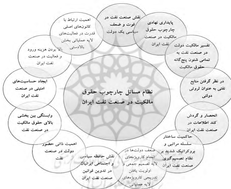
شکل شماره ۳: مسیرهای مؤثر بر شکل‌گیری چارچوب حقوق مالکیت صنعت نفت ایران

حال و بر اساس آنچه در خصوص برش‌های مفهومی فوق بیان گردید، مشخص است که الگوی موجود حقوق مالکیت صنعت نفت ایران در قالب ۱۳ مسیر مشخص، که تبیین‌کننده نظام مسائل حاکم بر حقوق مالکیت این صنعت هستند، ایجاد شده که در شکل شماره ۳ به آن اشاره شده است. همچنین، جدول شماره ۲ نیز، چگونگی نقش‌آفرینی تمامی این ارتباطات متقابل را در ایجاد الگوی کنونی حقوق مالکیت صنعت نفت ایران، به صورت یکجا نشان می‌دهد.