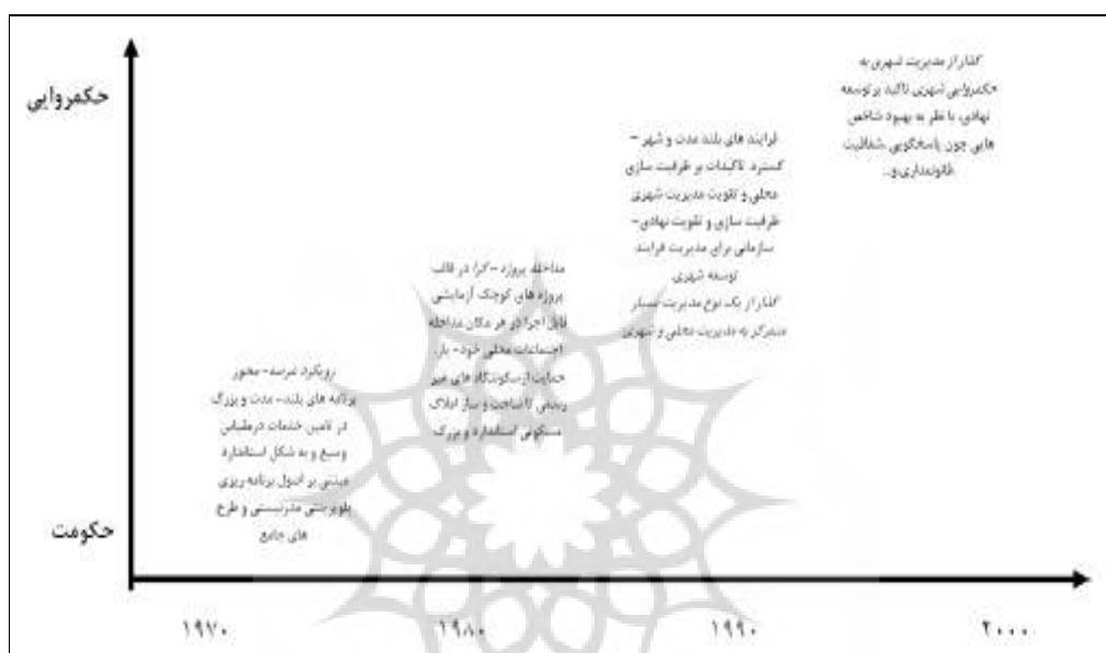
شکل (۲). سیر تحول رویکردهای اداره و مدیریت شهری منبع: (برگ پور و اسدی، ۱۳۸۷: ۵۰).

ساختار متناسب و کارآمد برای اعمال مدیریت است. در این ارتباط، مدیریت شهری باید دیدگاه جامع‌نگرتری درباره اجزا و عناصر سیستم شهری اختیار کند (Mcgill, 1998: 464). و رویکردی جامع و کل‌نگر به فرآیند ساخت شهر داشته باشد (van