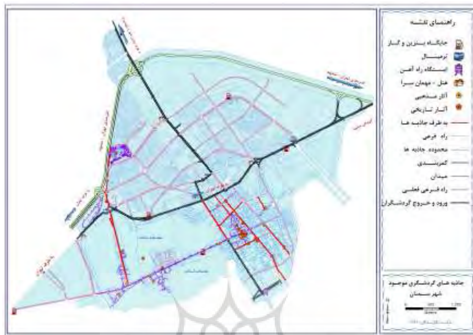
شکل ۲: جاذبه‌ها و مسیرهای گردشگری موجود شهر، مأخذ: یافته‌های میدانی نگارندگان، ۱۳۹۱

در این سال اقامت داشته‌اند. بیشترین تعداد گردشگر به استان در سال ۱۳۸۸ (۱۲۷۱۷۰۰۰) بوده است. علاوه بر این آمار اخذ شده از ستاد اسکان نوروزی استان سمنان که کار هماهنگی آنها توسط اداره میراث فرهنگی انجام می‌گیرد، به شرح جدول ۲ است.