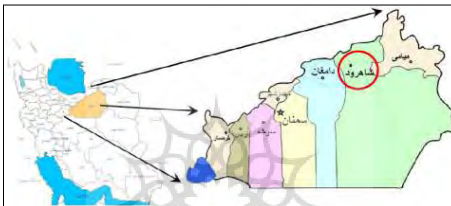
تصویر ۱- موقعیت جغرافیایی شهر شاهرود

همچنین ناحیه چهار با ۲۳۶۳۹ نفر به عنوان پرجمعیت‌ترین و ناحیه پنج با ۱۲۴۳۲ نفر به عنوان کم جمعیت‌ترین نواحی مطرح می‌باشند (مرکز آمار، ۱۳۹۰). جدول (۲)، تقسیمات کالبدی شهر را همراه برخی مشخصات آن ارائه می‌دهد.