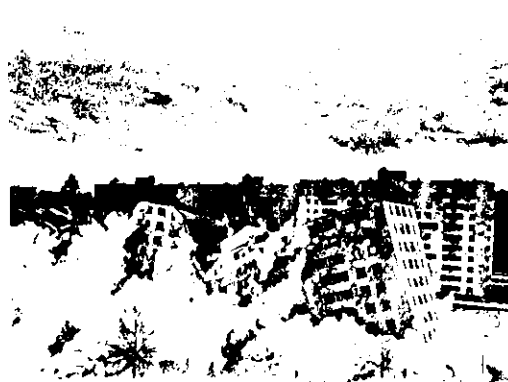
شکل ۳ ساختمانهای بلند مجتمع پروینت ایگو در حال بهره‌برداری در حال انفجار با دینامیت ۱۹۷۲ میلادی [۶].