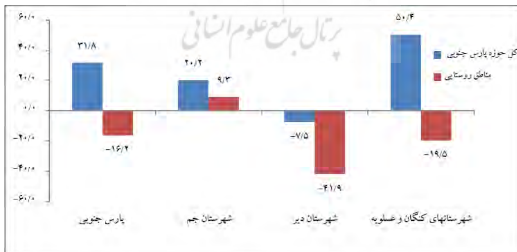
شکل ۲- نرخ خالص مهاجرت در حوزه پارس جنوبی