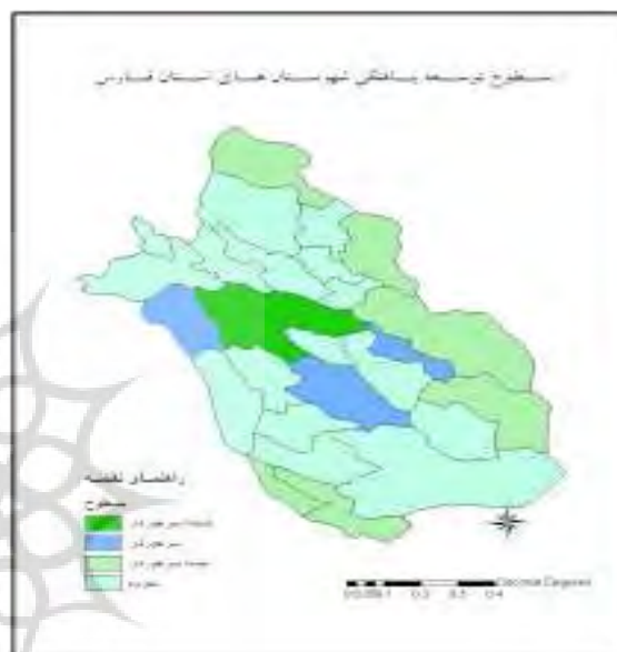
شکل ۲. نقشه سطوح توسعه یافتگی شهرستان‌های استان فارس

شهرستان شیراز بوده است. بنابراین شهرستان‌های نو پا که از سال ۱۳۸۵ به بعد مستقل شده اند، با وجود این که در مرکز استان واقع شده اند ولی جزء محروم‌ترین شهرستان‌ها هستند. بنابراین فرضیه اول تأیید می‌گردد و نابرابری در سطح استان مشهود است.